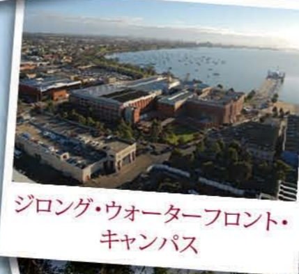
ジロング・ウォーターフロント・キャンパス

ジロング・ウォーターフロント・キャンパスは、ジロングの中央ビジネス地区にある、大幅な改装が施された歴史的建造物で、景色のよいコライオ湾を見渡せるところにあります。