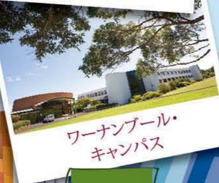
ワーナンブール・キャンパス

ホプキンス川岸に位置し、世界的なサーフィンビーチに近いディーキン大学、ワーナンブール・キャンパスは、学生と職員が個人的に打ち解けて付き合えるようなフレンドリーで緊密なコミュニティです。