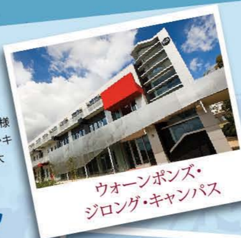
ウォーンボンズ・ジロング・キャンパス

ウォーン・ボンズのジロング・キャンパスには、手入れのゆきといた広大な土地や、幅広い様々なスポーツ施設があります。2番目に大きいキャンパスであり、この中にはディーキン医科大学もあります。