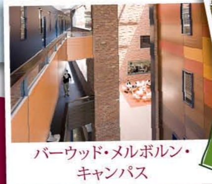
バーウッド・メルボルン・キャンパス

バーウッド・メルボルン・キャンパスは、ディーキン大学で最大のキャンパスであり、社交や勉強のために開かれた魅力的なスペース、革新的な建築、広大な新しい建造物、多数のワイヤレス接続スポットがあることを誇りとしています。