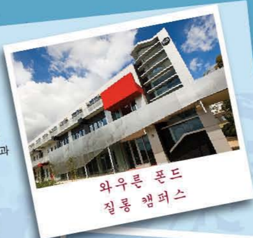
와우른 폰드 질롱 캠퍼스

와우른 폰드의 질롱 캠퍼스는 넓은 대지와 폭넓은 스포츠 시설을 특징으로 합니다. 디킨 대학 캠퍼스 중 두 번째로 큰 곳으로, 디킨 의과 대학이 소재한 곳이기도 합니다.