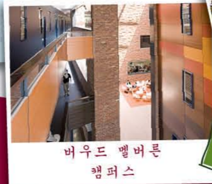
버우드 멜버른 캠퍼스