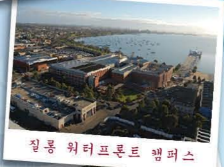
질롱 워터프론트 캠퍼스

질롱 워터프론트 캠퍼스는 질롱의 상업 중심지에 자리잡고 있으며 아름다운 코리오만(Corio Bay)을 내려다보는 고풍스러운 건물을 전면 고친 것입니다.